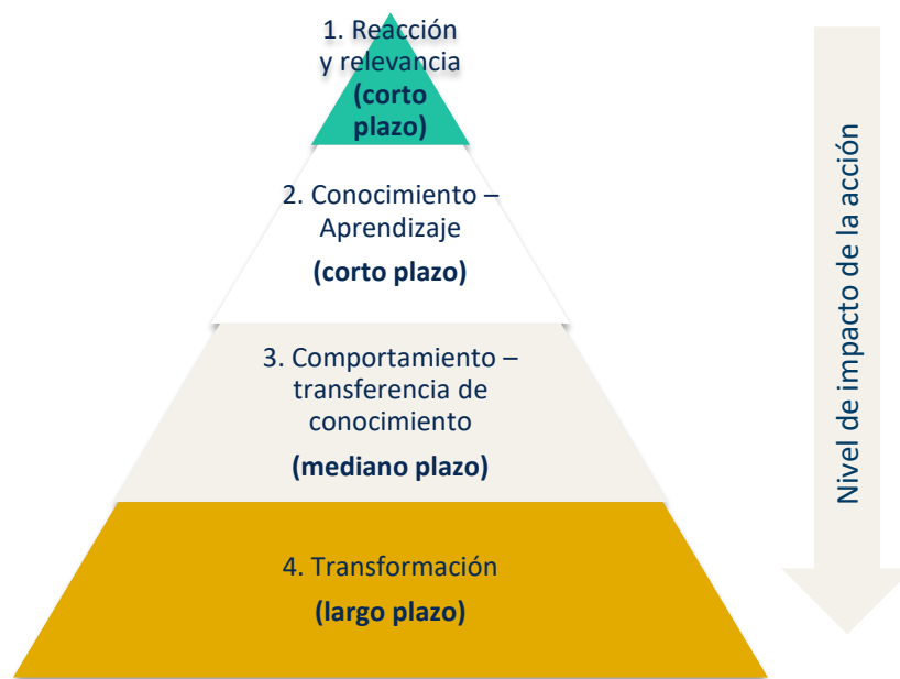
Figura 5. Representación piramidal de los niveles de impacto.

Finalmente, se ha elaborado un plan de seguimiento en el que se establecen indicadores a diferentes niveles que permitirán: evaluar la implementación de esta estrategia y seguir avanzando en la consecución de objetivos del plan de acción, y también servirán para evaluar el nivel de profundidad al que se desee llegar en cada momento de su implementación (Figura 5).