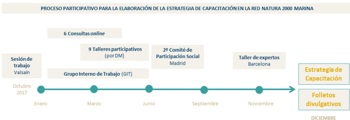
Figura 2. Esquema del proceso participativo llevado a cabo para elaborar la Estrategia de Capacitación.

Se ha contado con la participación de más de 250 personas de diferentes colectivos para la consecución del plan de acción, de las cuales más de 100 han participado de forma presencial en los 9 talleres que se han celebrado en 9 ciudades del territorio en las 5 demarcaciones marinas (DM) que establece la estrategia marina europea. A continuación se detalla el esquema del proceso participativo que se ha seguido (Figura 2).