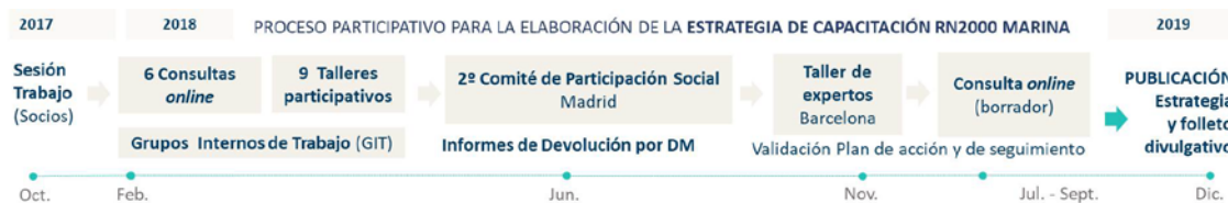
Figura 2. Esquema del proceso participativo llevado a cabo para elaborar la Estrategia de Capacitación.

Se ha contado con la participación de más de 250 personas de diferentes colectivos para la consecución del plan de acción, de las cuales más de 100 han participado de forma presencial en los 9 talleres que se han celebrado en 9 ciudades del territorio en las 5 demarcaciones marinas (DM) que establece la estrategia marina europea. A continuación se detalla el esquema del proceso participativo que se ha seguido (Figura 2).