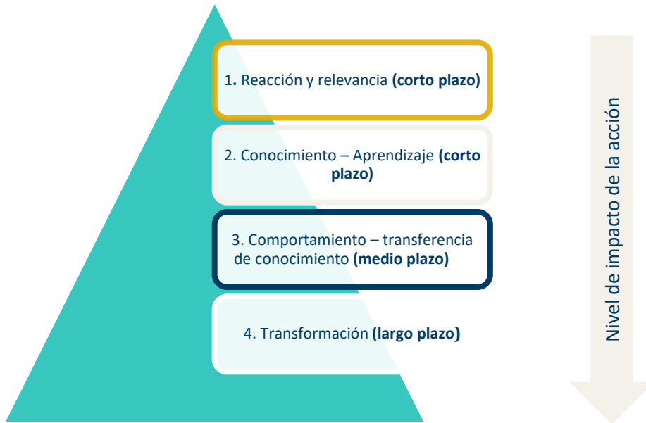
Figura 5. Representación piramidal de los niveles de impacto.

Finalmente, se ha elaborado un plan de seguimiento en el que se establecen indicadores a diferentes niveles que permitirán: evaluar la implementación de esta estrategia y seguir avanzando en la consecución de objetivos del plan de acción, y también servirán para evaluar el nivel de profundidad al que se desee llegar en cada momento de su implementación (Figura 5).